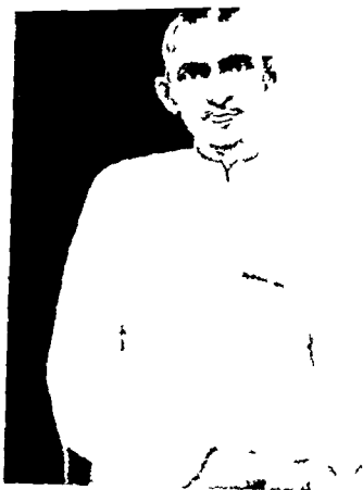
जेम्स से वूटन के बाद ( दक्षिण अफ्रीका )